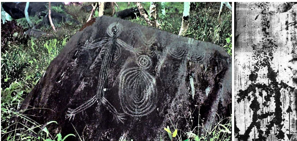
Fig. 8a: Partenaires sexuels kanak (Napwé Brangra, Nouvelle Calédonie; Photo M. Larrey /1999) b: Partenaires sexuels camuniens (Foppe di Nadro, Italie; Tactigramme: L. Dubal/ 1993)

3 ème solution : «Le livre qui s'ouvre» ou l'ouverture du couple selon un axe parallèle permet une grande liberté et se trouve en Océanie comme en Europe. Avec cette solution, la position relative des partenaires devient une préoccupation secondaires du lapicide. La Fig. 8a présente un couple proto-kanak gravé sur un rocher de 1,80 m de hauteur à Napwé Brangra [10] . La structure «type oignon» des protagonistes et les parties génitales en médaillon sont des plus intéressantes.