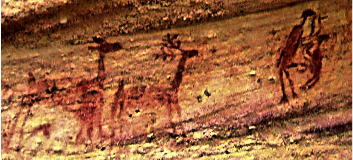
Fig. 7: Partenaires sexuels paléo-américains : (Toca do Pau d'Arco, Piauí, Brésil; Photo Dubal/ 2009)

Notons que la position en levrette des partenaires proto-berbères semble avoir été universellement pratiquée. La vue latérale permet en outre la représentation d'autres positions...par exemple le face à face des "amoureux aux bras relevés", peints à Toca do Pau sur une paroi rocheuse de la Serra da Capivara [9] , Brésil (voir Fig. 7). Cette innovation retient toute l'attention du couple de visiteurs cervidés !