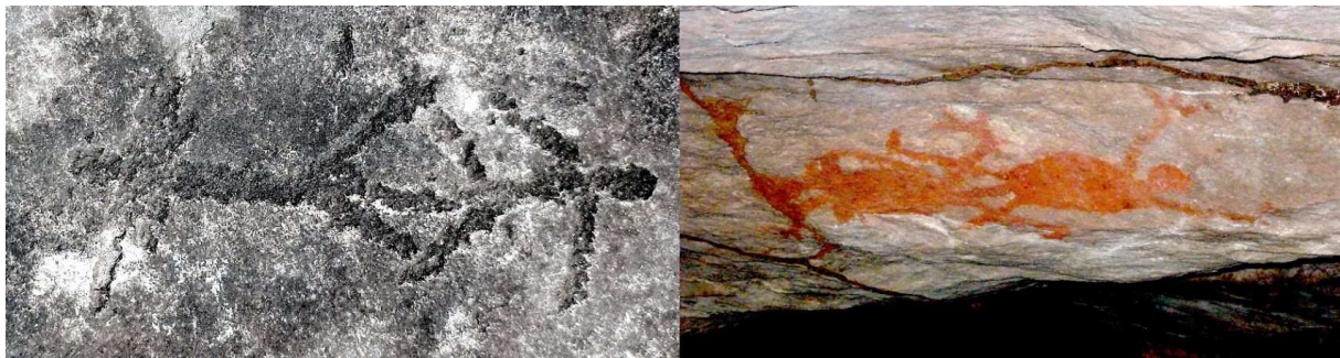
Fig. 4a-b: Partenaires sexuels aborigènes: (Brady Ck, Qld, Australie. 2012)

rivière a une "jumelle", la grande peinture monochrome (voir Fig. 4b) ornant le plafond d'un abri sous roche voisin.