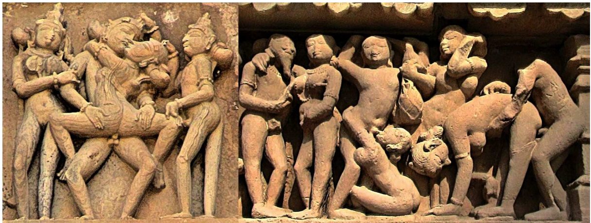
Fig. 2 a-b: Statues lascives ( Khajuraho, M.D., Inde)

érotique, les statues lascives millénaires de Khajuraho, en Inde (voir Fig. 2a-b), rivalisent avec leurs précurseurs paléo-américaines.