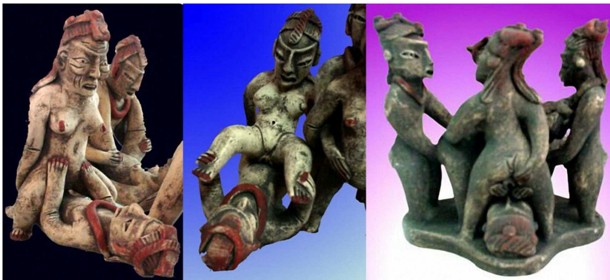
Fig.1: Figurines érotiques Tlatilco (Fundación A. Nuñez Jiménez;)