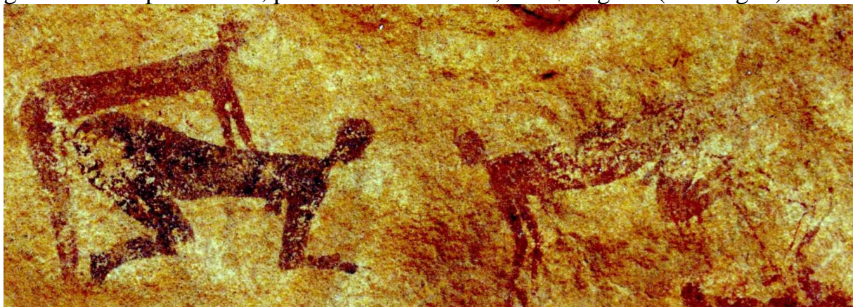
Fig.6 Peinture érotique proto-berbère (Tassili n'Ajjer, Algérie, Photo : M. Larrey, 1992)

2 ème solution : La vue latérale permet aussi de mettre en évidence les parties génitales des partenaires, p.ex. à Inaouanrhat [8] , Illizi, Algérie (voir Fig. 6).