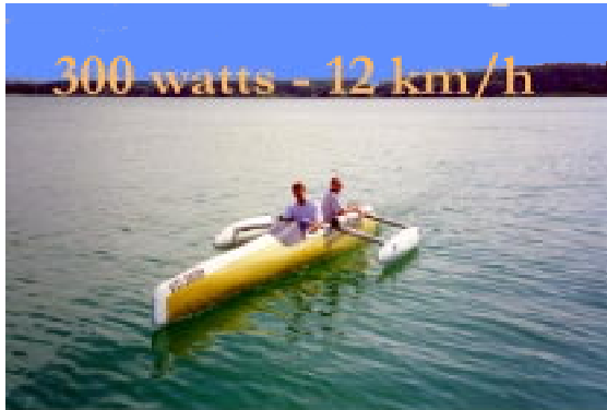
Démonstration au solstice d'été, à Hergiswil

Ce Consortium [5] a regroupé l'EIVD-Yverdon et le SILSE-Lausanne. L'EIVD a équipé d'un Powerpack de 300 W @ 12 V DC H 2 /air l' Hydroxy300 , un trimaran de MW-Line. Grâce à son profil, la vitesse de croisière est de 12 km/h avec deux passagers à bord. Le Powerpack avait été développé au PSI et construit à la HES-Granges, dans la période 97-98.